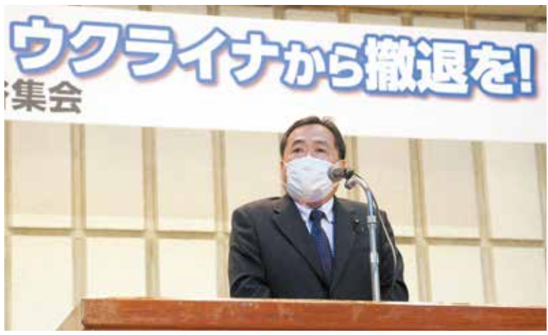
ロシアは侵略やめろ、ウクライナからの撤退を！ 4.8日比谷集会

復帰50年の節目、沖縄北方特別委員会では沖繩振興法改正案の審議が行われました。私も委員として質問に立ち、必要な施策や制度の創設を提言しました。 安全保障委員会では、P F A S や嘉手納基地の爆音問題を取り上げる中で「地位協定の改定なくして基地負担の軽減はない」と繰り返して主張しました。