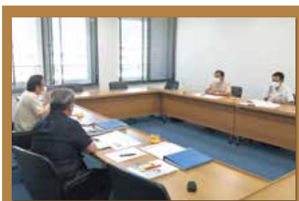
防錆整備格納庫移転ヒアリング (嘉手納町)