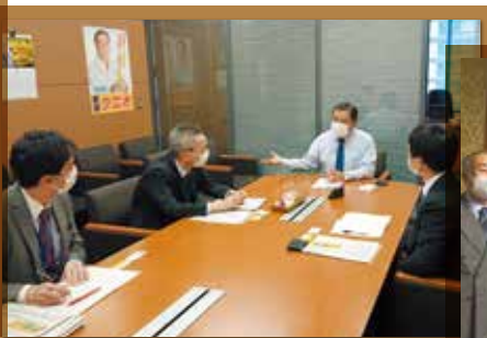
水産庁レク (軽石問題 ろ過機保険適用)