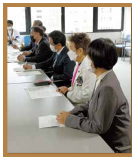
那覇軍港訓練抗議 (外務省沖縄事務所)