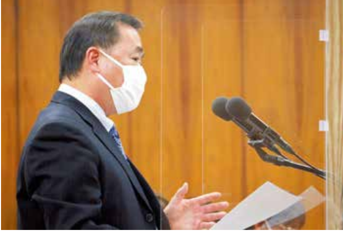
沖縄北方特別委員会 (12月7日)

「選挙イヤー」となった昨年は、県知事選挙をはじめとする各自治体首長選挙や議員選挙、夏の参議院選挙におきまして、私の応援する各候補者に皆様の多大なご支持・ご支援を賜りました。日頃より国会内外における私の活動を支えて下さり、心から感謝を申し上げます。