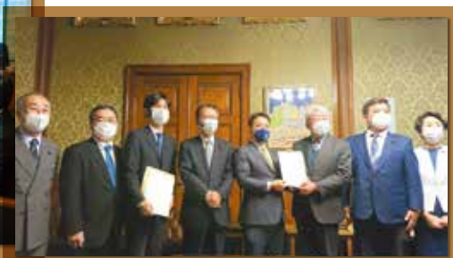
コロナ特別給付金 野党法案提出