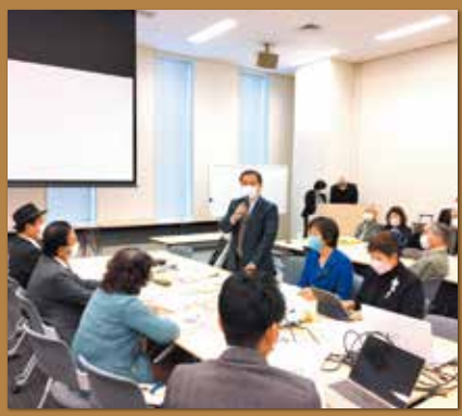
PFAS市民連絡会 (国会要請・院内集会)